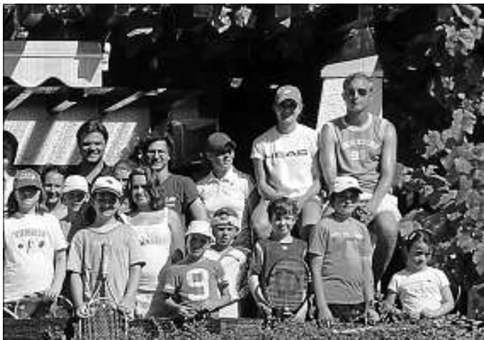
Trainerteam des TCH bei der Freizeit 2012