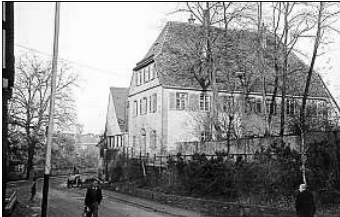
Das evangelische Pfarrhaus, Münchinger Straße, 1954

lichen noch im Alten Dorf. Notunterkünfte waren in der "Glemstalsiedlung" hinter der Schlossmühle errichtet worden. Erst zu Beginn der 50iger Jahre wurden neue Häuser gebaut. Das Haldengebiet, das Beutenfeld, der Korntaler Weg und Wohngebiete südlich der Eisenbahnstrecke in der Flur "Stütze" wurden nun nach Plänen, die schon Ende der 20iger Jahre entwickelt wurden, erschlossen und überbaut. Die Zahl der Haupt- und Nebengebäude stieg von 1.177 im Jahr 1950 auf 1 888 im Jahr 1960.