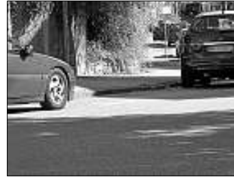
Der kombinierte Fuß-/Radweg hinter der Wilhelmschule: durchaus eine Errungenschaft, mit Raum für Verbesserungen

auch Fußgänger unterwegs sind und Autotüren aufklappen, hat zwar nicht unrecht - als Radler sollte man aber grundsätzlich dankbar sein für die Verbindung, nach dem Motto: Besser so als gar nicht. Genau deshalb hat sich schließlich seinerzeit auch die Grüne Liste maßgeblich für diese Idee eingesetzt.